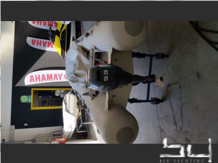
Vista esterna - Immagine 3