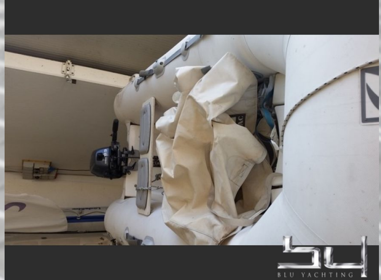
Vista esterna - Immagine 2