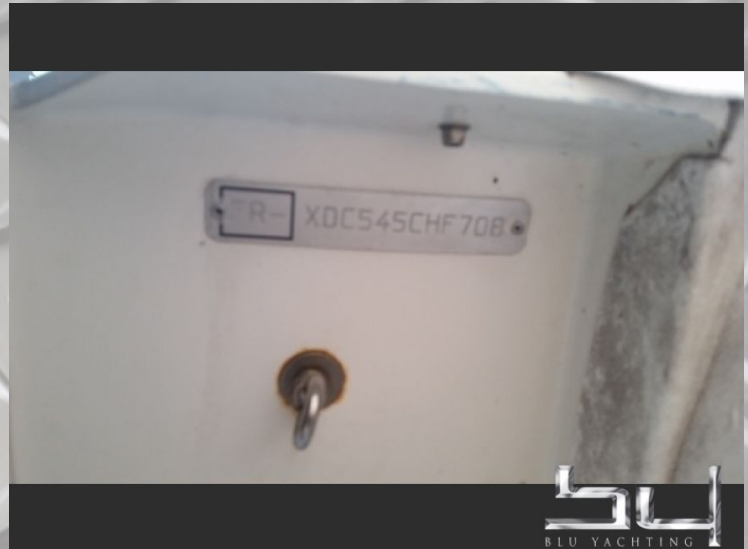
Vista esterna - Immagine 4