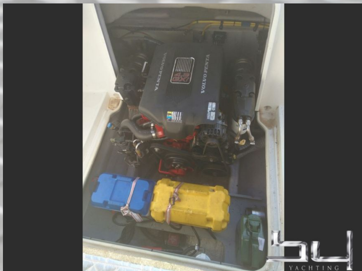
Vista esterna - Immagine 8