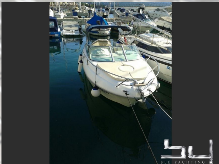
Vista esterna - Immagine 7