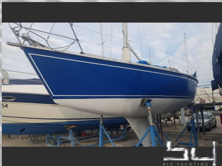
vista exterior - Imagen 2