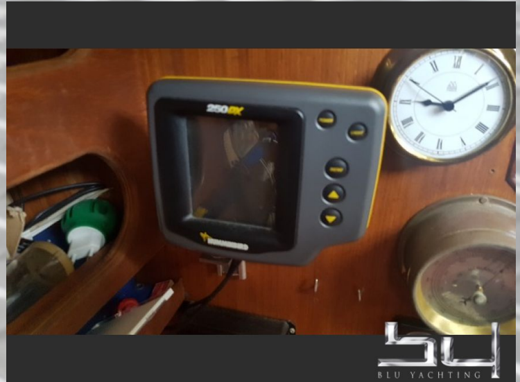
vista exterior - Imagen 8