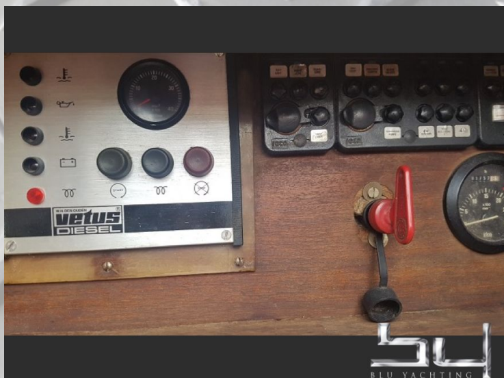
vista exterior - Imagen 6