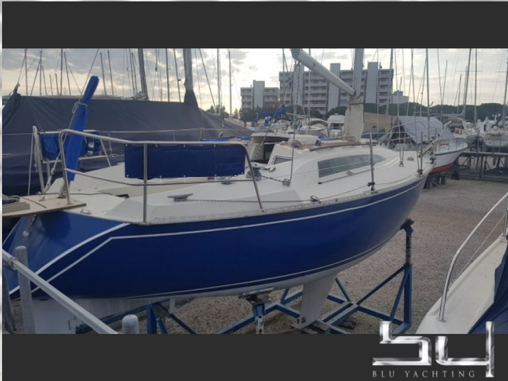
vista exterior - Imagen 1