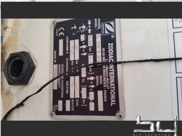
vista exterior - Imagen 5