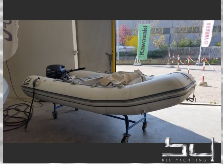
vista exterior - Imagen 8