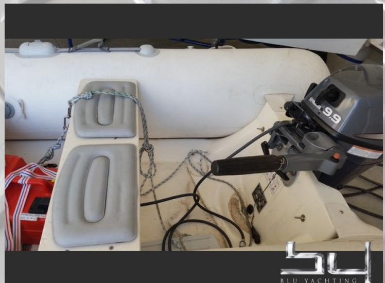
vista exterior - Imagen 6