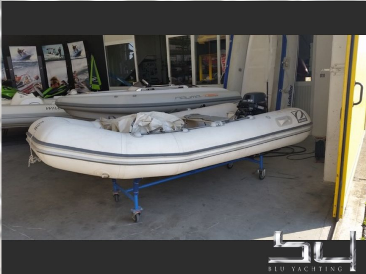
vista exterior - Imagen 1