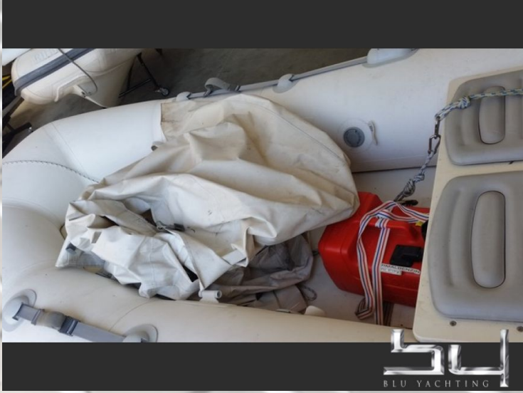
vista exterior - Imagen 7