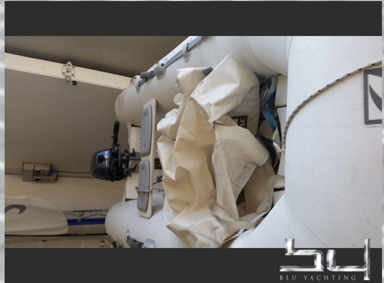
vista exterior - Imagen 2