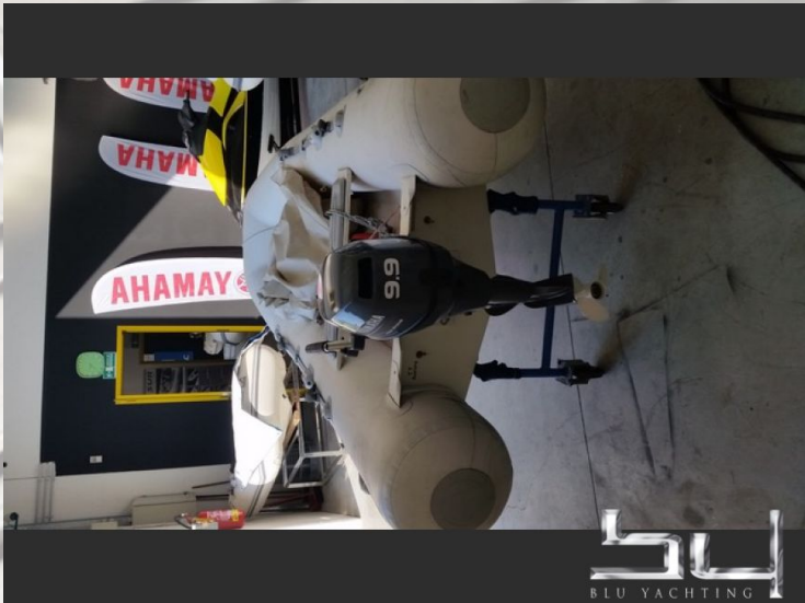
vista exterior - Imagen 3