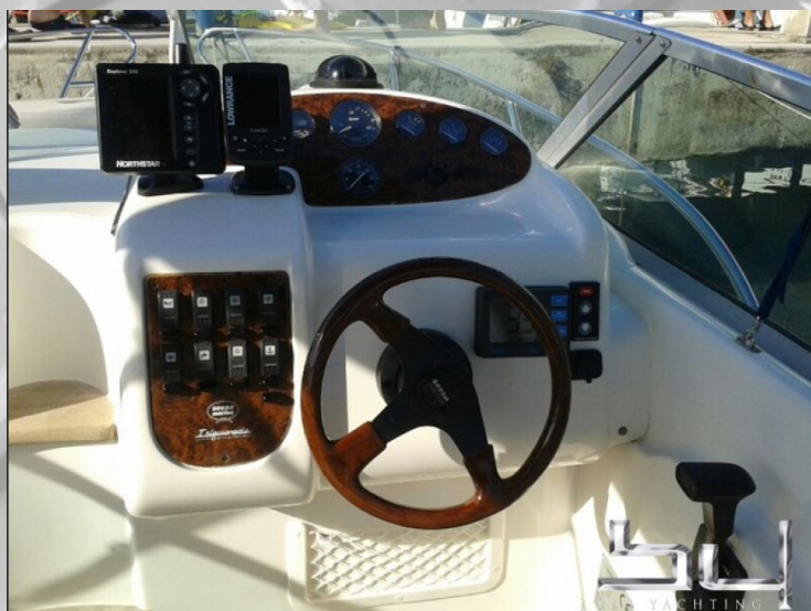
vista exterior - Imagen 6