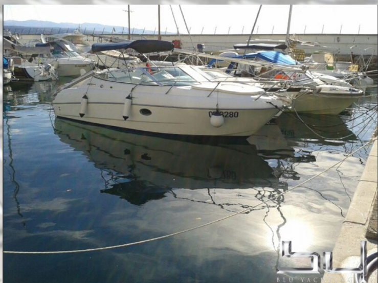
vista exterior - Imagen 1