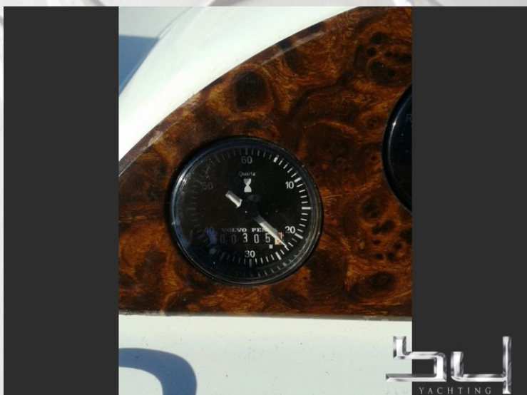
vista exterior - Imagen 5