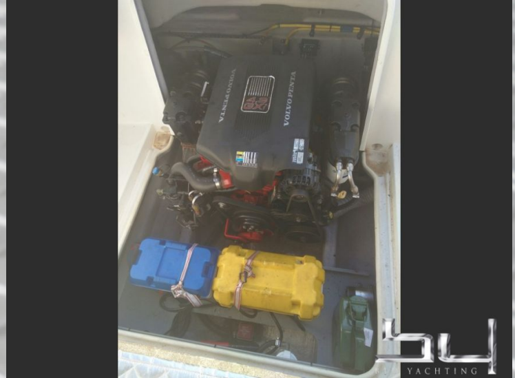
vista exterior - Imagen 8