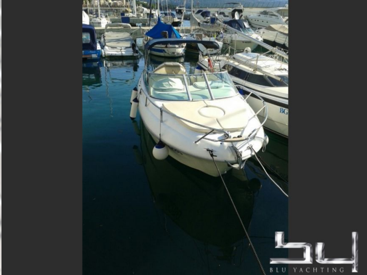
vista exterior - Imagen 7