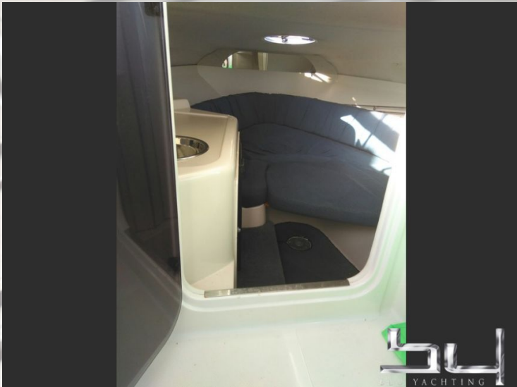
vista exterior - Imagen 9