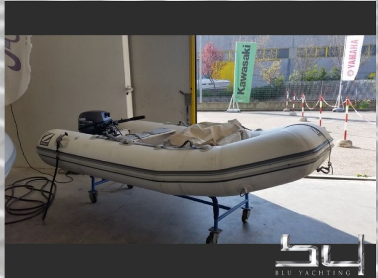
Aussenansicht - Bild 8